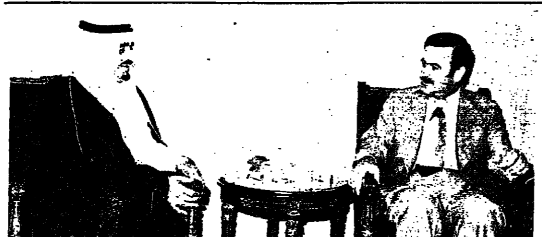
الرئيس الأسد والامير فهد في دمشق امس

قال الشيخ بيار الجميل امس في الكتابه مستعمداً بكون تورد لحمل الجنديا على ان تعود الدولة التي تولي سلطتها كاملة، ولكن السيد كمال الجميل قال ان لا احد يتردد ان يحصل الميليشيات قبل ان يخلص جميع اللبنانيين حقوقهم. وقال الجميل: ردت مراراً ان البلد الذي يتواجد فيه السلاح يابدي الانزاع والميليشيات خارجة عن سلطة الدولة ويهوية مجهولة، هو بلد يبري غير محتمل. وقد اعلمنا مراراً ان الكتائب مستعدة وبدون تردد وتك صق ان تدل كل المقامير السلاح والميليشيا والتدريب، وان الضرورة تفرض ذلك ولكن بشرط ان تدل سلطان الميليشيات وان يخفي السلاح من ايدي افراد والجماعات لانه ليس من المعقول ان نطلب احداً ان لا يتدفع عن نفسه عندما لا يجد من يدافع عنه. كما انه ليس معقولاً ان تكون هناك قوات تحمل السلاح لاي سبب مهما كان شريفاً وان يخلص هذا السلاح من قبل الجيش للاعتقاد على الاغراض والممتلكات ان جو من الانتماء والسلطة ووقوفها بكافة الاتحاد باي عمل، وان مال هذه الاموال هي التي ارغبت اللبناني على اقتناء السلاح للدفاع عن نفسه عندما وجد نفسه امام هذا الواقع المزم.